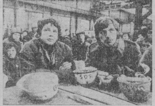
ПРОДОЛЖАЕТСЯ борьба трудящихся Лотарингии против новых увольнений в металлургической промышленности, основной отрасли работы потерял еще 26 тысяч металлургов.