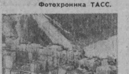
На снимке, так выглядит сейчас уникальная арочная плотина.