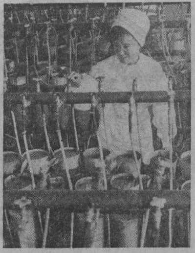
ИРГИЗСКАЯ ССР. Закладку икры миссы, кушавшей форели и сибирской пеляди на инкубацию завершили специалисты Томского и Нараньского рыбных заводов.