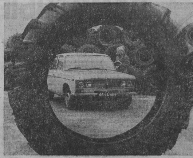
Высокие обязательства на 1979 год взяли труженники Барнаульского шинного завода. Они решили выдать сверхплановой продукции на 200 тысяч рублей, добиться присвоения государственного Знака качества двум видам изделий.