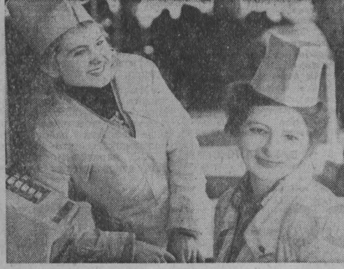
УНИВЕРСАМ - самый большой и современный магазин в Новокузнецке...