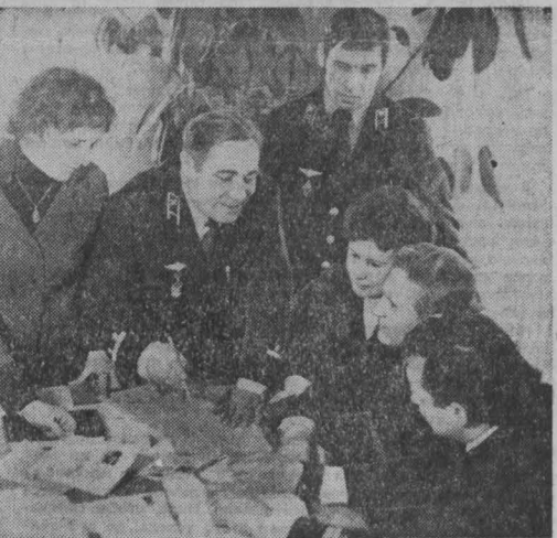
В. СИТНИКОВ, второй секретарь обкома КПСС.