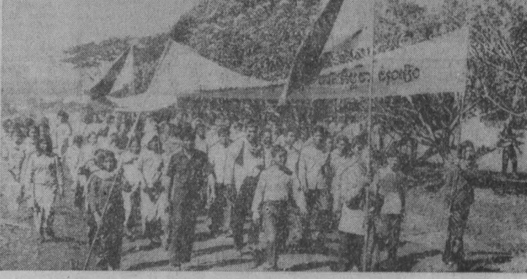
НА СНИМКЕ: жители освобожденного района направляются на митинг.

«Мы — страна номер один, и мы намерены и впредь оставаться страной номер один». Он говорил не об экономике, не о культуре, не о правах человека, а о размерах военной машины. Со старыми представлениями расставаться неслучко. И вот газета «Вашингтон пост» уже пишет в редакционной статье, что «безопасности в большей мере гарантируется непрезвиденной силой, а не контролем над вооружениями... Сенат, как мы подозреваем, отстанет от предложения, а не от ограничения стратегических вооружений и разрушения». Все это похоже на возврат к додоговорной военной логике, по которой чем больше у генералов слонов, копий, сабель, пушек, тем больше шансов оказаться победителем. ОСВ-2 предлагает решать проблемы безопасности в соответствии с логикой ядерной эпохи, когда разумнее отказаться от