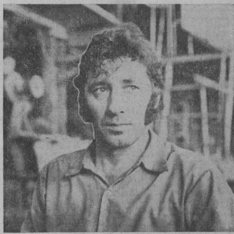
Делегат областной партконференции