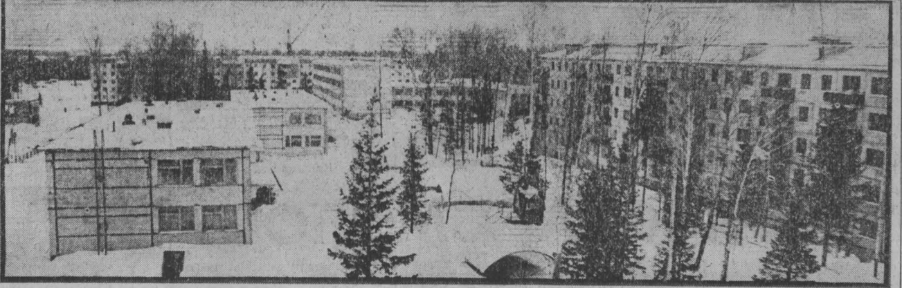
Среди тайги поднимаются жилые кварталы Зеленогорского.

ДАЖЕ на самых новейших картах нашей области не найти этого поселка, поднимавшегося на высоких сопках, что остановили свой бег у стремительной красавицы Томи. Своим названием поселок оправдывает. Среди тайги, которую строители бережно сохраняют, поднимаются жилые дома Зеленогорского. Поселок гидростроителей только начинает свою трудовую биографию. Рассказ о Зеленогорском читайте на 2-й стр.