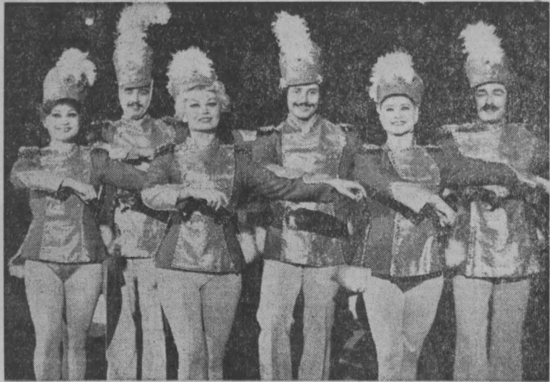
НА АРЕНЕ ЦИРКА