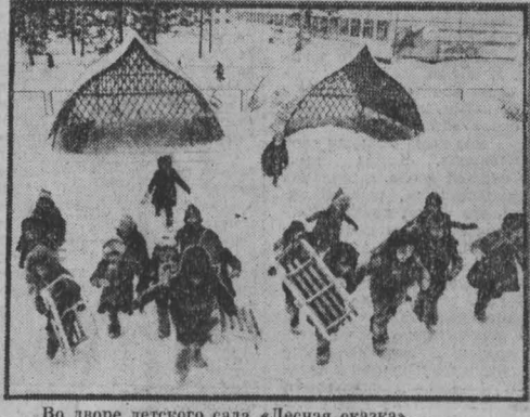
Во дворе детского сада «Лесная сказка».