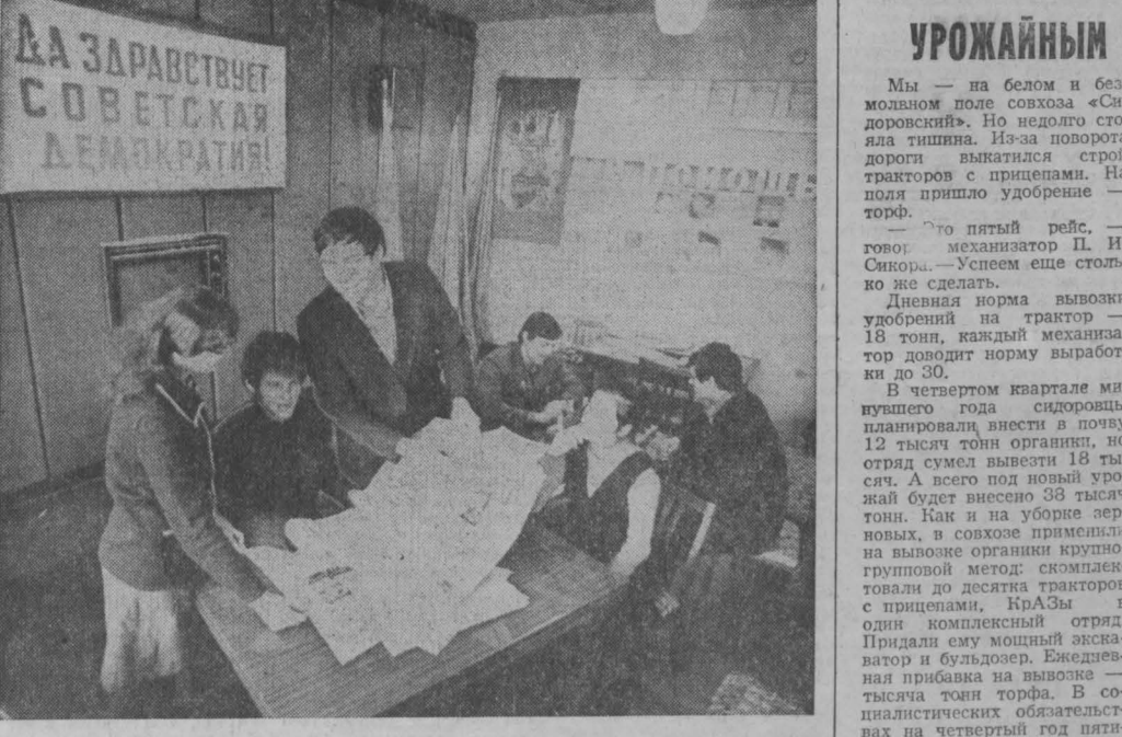
Агитпункт избирательного участка 145/260 расположен в красном уголке совхоза «Кратвинский». Здесь сделано все, чтобы выглядел он уютно и гостеприимно. Помещение агитпункта красочно оформлено. По вечерам в агитпункте можно послушать лекции о международном положении, о внешней и внутренней политике Советского государства. Большое внимание уделяется учебе агитаторов, а их в совхозе пятнадцать.

Начало нового года стало для них началом новой пятилетки, началом пути к новым трудовым успехам. Принимаемая социалистическая ответственность в честь предстоящих выборов в Верховный Совет СССР, передовые производственные решимости не снижать темпов и выполнять квартальный план за два месяца.