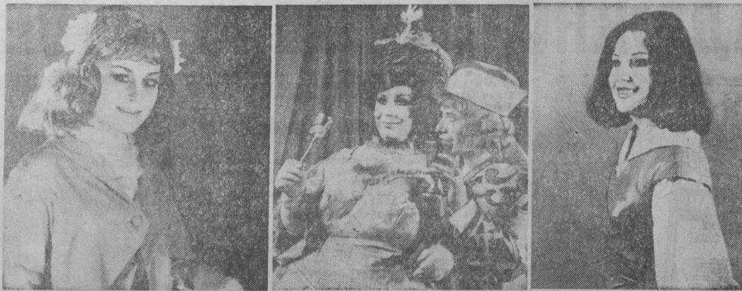
Штрихи к творческому портрету