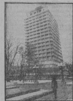
НА СНИМКЕ: к услугам гостей Олимпиады-80 комфортабельная гостиница «Киев»

Готовят именные и интересную культурную программу.