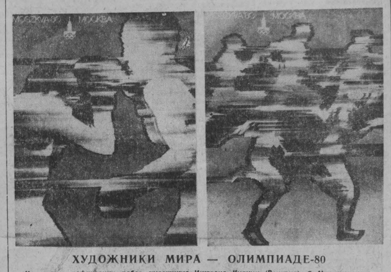
ХУДОЖНИКИ МИРА — ОЛИМПИАДЕ-80. Из серии графических работ художника Иштвана Кулини (Венгрия), с Международного конкурса «Планет Олимпиады-80».

Летом 1867 года «Голубой Дунай» начал свое триумфальное шествие по странам и континентам.