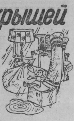
Лы, время и рабочая сила на заделывание крыши.

Переход в снабжении случился и раньше, но чтобы металл шел в дело, как говорится, с колес, — такого не было. Для ритмичной работы предприятия необходим как минимум месячный запас металла соответствующего профиля, а завод имеет его на два-три дня, к тому же всего трех—четыре разновидности. Нельзя сказать, что дирекция завода не принимает мер для улучшения снабжения. Не раз обращались в трест, и в Главкузбастрой, но дело не поправляется. А. ПОНОВ, внештатный корреспондент «Кузбасса», г. Юрга.