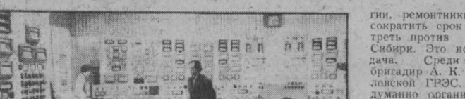
НА СНИМКЕ: центральный пульт управления Беловской ГРЭС.

— Камнетса, немного? — Что значит «немного»? У нас в Сибири как раз не хватает этого миллиарда. А ведь это только одной области столько расходуют. Именно был взял ту энергию, которой сейчас не хватает. Равнатов мы сняли и таблицку «Ходи, гаси свет». Известное постановление Центрального Комитета КПСС, одобряющее опыт Кузбасса по экономии топливно-энер-