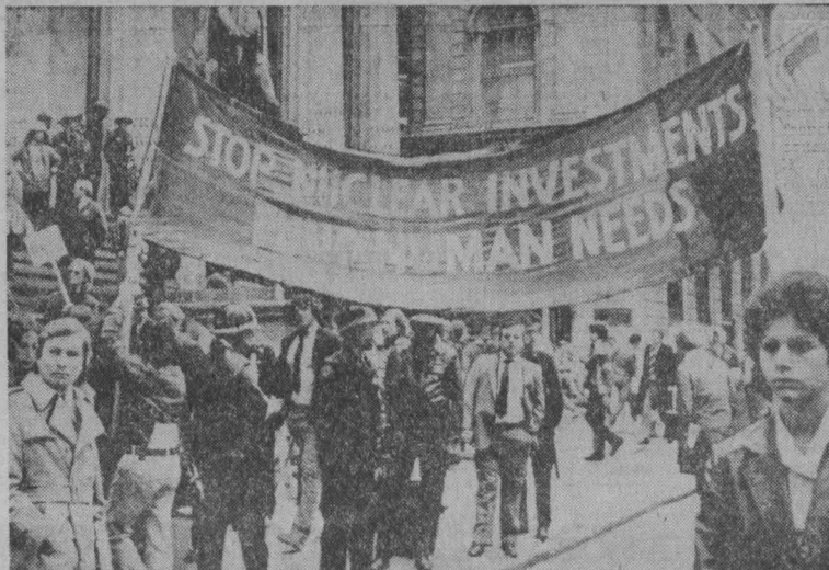
США. Мощные выступления сторонников мира против опасных планов наращивания американского ракетно-ядерного потенциала прошли по городам Соединенных Штатов.

ВАШИНГТОН, 18 декабря. (ТАСС). Соединенные Штаты продолжают оказывать грубый нажим на Иран. Выступая в телевизионном интервью, министр обороны США Г. Браун вновь заявил, что наряду с политическими, дипломатическими и экономическими мерами воздействия на Тегеран правительство США располагает и другими возможностями. При этом он напомнил, что близки иранские берега сосредоточены очень мощные боевые авианосные группы. Существует, сказал Г. Браун, и другие чрезвычайные планы, в которых в предположении пока не говорить.