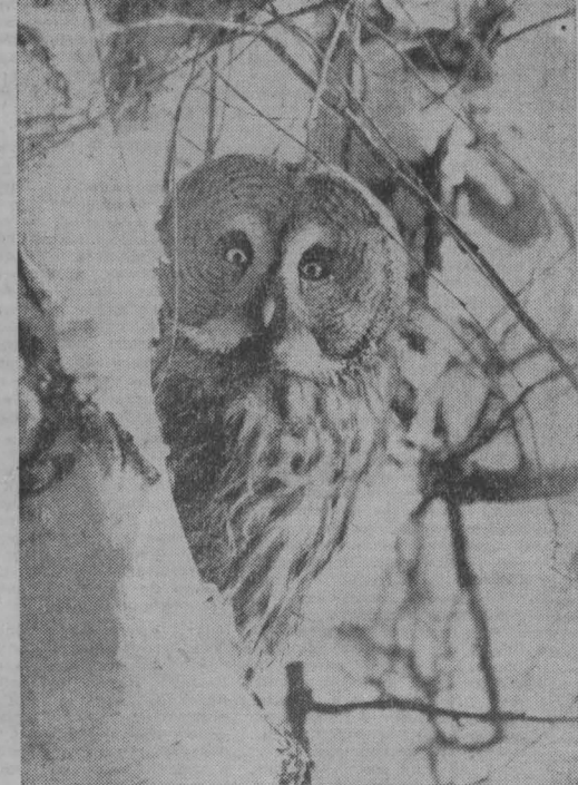
СТРАЖ ТАИГИ — БОРОДАТАЯ НЕЯСЫТЬ.