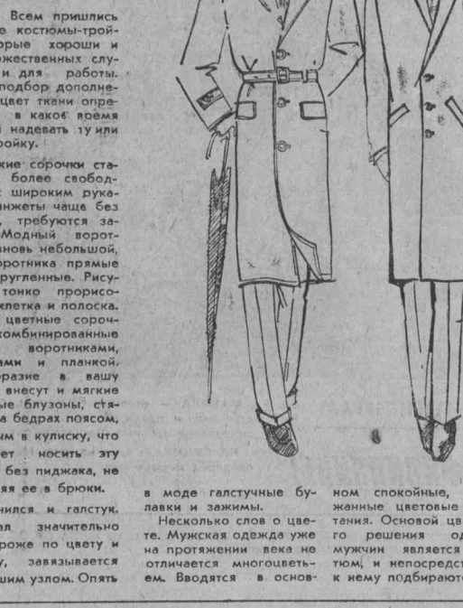
Рисунки Г. Портной. г. Кемерово.

В одежде наблюдается сегодня большая свобода выбора, разнообразие форм и видов, меньше стало ограничений. Особое внимание сейчас уделяется одежде спортивного характера, в которой используются мотивы, взятые из костюма для активного спорта, из униформы и рабочей одежды.