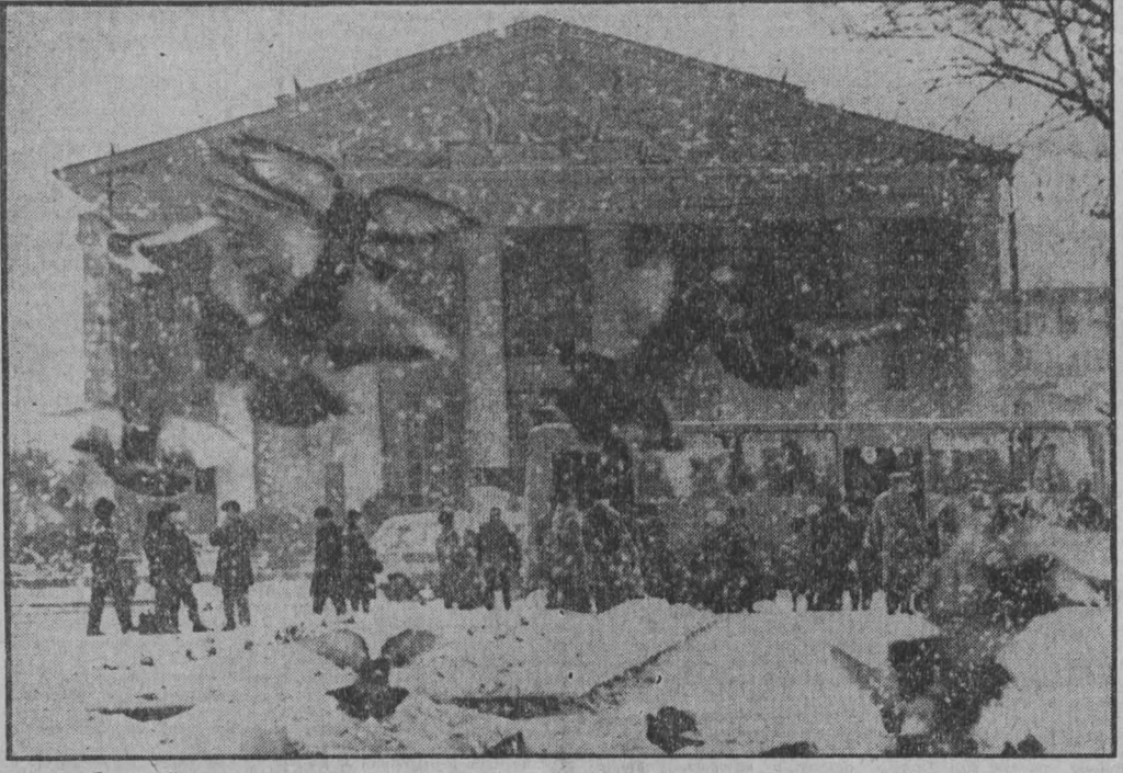
Зимний день

1919 год, 19-20 декабря. Регулярные части Пятой Красной Армии начали освобождение Кузбасса от колчаковщины. Боевые действия против белогвардейцев в Кузнецком бассейне вели 27-я, 30-я и 35-я дивизии. Особенно ожесточенными и упорными были бои в районах Щегловска (ныне Кемерово) и Тайги.