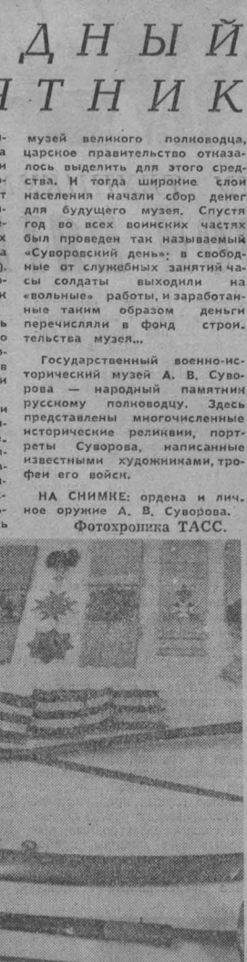
НА СНИМКЕ: ордена и личные ордена А. В. Суворова. Фотохроника ТАСС.