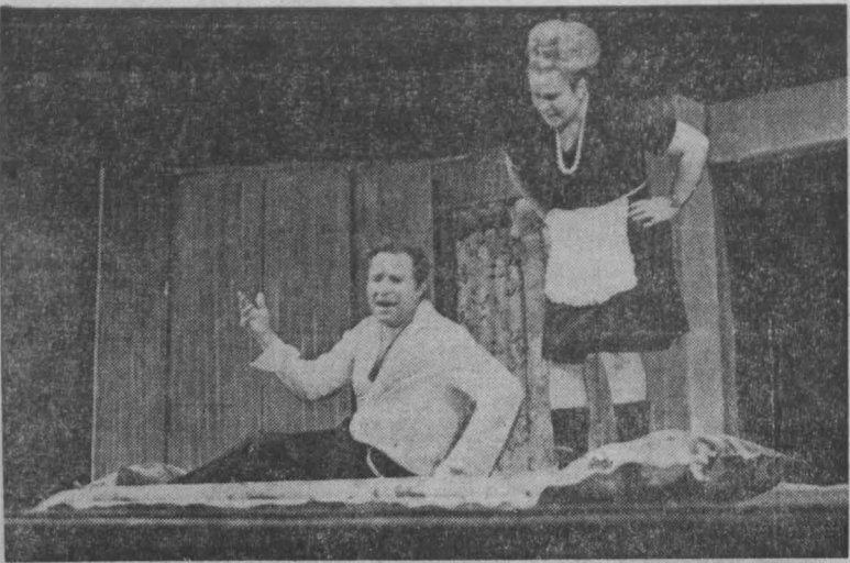
С 1963 ГОДА существует в Кузбассе театр народного творчества профсоюзной организации. Лучшие модели и коллективы и отдельные исполнители получают право выступать на его сценических площадках, а они расположены по всей области — во Дворцах культуры.

Сезон 1979/80 года выпала честь открыть дипломату первого Всесоюзного фестиваля самодельного художественного творчества трудящихся — народному театру-студии Дворца культуры Заспика, который на сцене клуба конкожизма в Кемерове показал «Провинциальные анекдоты» А. Вампилова.