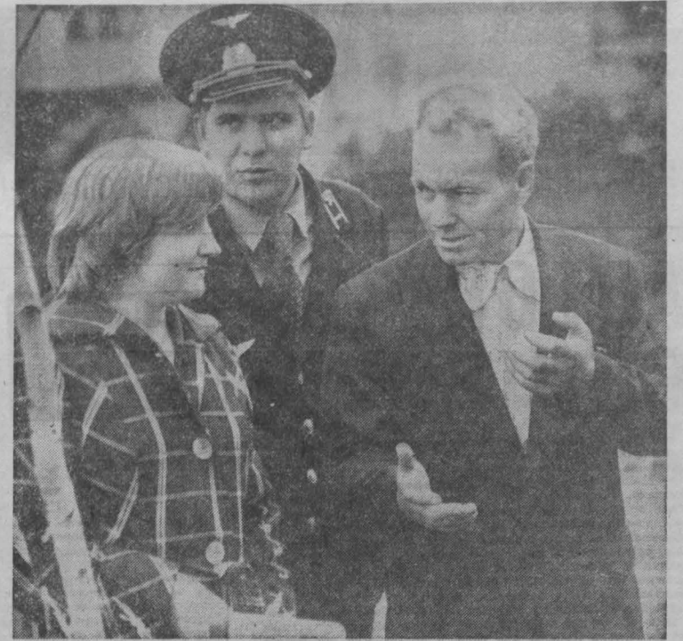
Железнодорожники станции Томусинская в социалистическом соревновании среди многочисленных коллективов Новокузнецкого отделения в этом году неоднократно признавались победителями. Они в числе первых выполнили годовое обязательство и сверх плана отправили 769 тысяч тонн угля концентрата обогатительной фабрики «Сибирь».

Г. ЗАДОРЖНЫЙ, корр. «Кузбасса», г. Мыски.