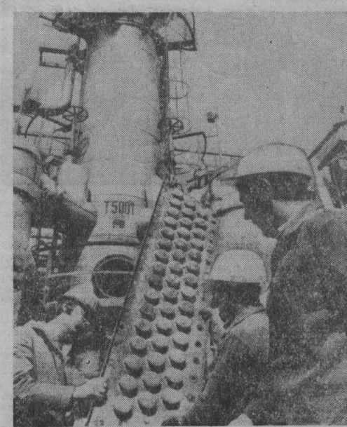
Широкие и многогранные аспекты имеет сотрудничество ГДР со странами-членами СЭВ в области химической промышленности.

заложников для невыполнения политических требований». «Никто не должен недооценивать решимости американского правительства», — добавил он. — «Необходимо исключить какие бы то ни было предположения на тот счет, что экономический нажим может ослабить нашу позицию. Я отнюдь не собираюсь прекращать закупки нефти у Ирана, предназначенной для поставок в Соединенные Штаты».