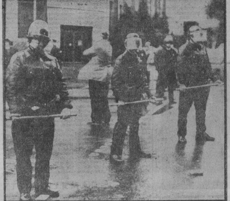
В Соединенных Штатах полиция всегда готова обрушить резинные дубинки на головы тех, кто борется за свои жизненные права. Более 200 полицейских были брошены на разгон пикетчиков у ворот завода компании «Олин» в Нью-Хейвен (штат Коннектикут). 1 350 рабочих этого предприятия объявили забастовку четыре месяца назад, протестуя против потогонной системы труда на заводе. НА СНИМКЕ: полицейский кордон у ворот завода.

ВАШИНГТОН, 14 ноября. (ТАСС). Обострение ирано-американских отношений остается в центре внимания Белого дома. По словам высокопоставленного представителя администрации, «правительство работает над этой проблемой 24 часа в сутки». На специально созванной пресс-конференции президент США Дж. Картер объявил о прекращении закупок иранской нефти. По словам представителей администрации, сдерживание импорта нефти из Ирана, может привести к дальнейшему росту цен на бензин и другие нефтепродукты в США. Официальные представители Белого дома продолжают отрицать возможность применения сил Соединенных Штатов военной силы для освобождения заложников. Тем не менее американская печать сообщает об активизации военных приговоров в США. Так, на военной базе Форт-Худ (штат Техас) начались военные учения «по проверке срочной мобилизационной готовности американских войск. По программе этих маневров под кодовым названием «Дрозд» том XII проводится мобилизация нескольких тысяч военнослужащих с различными базами США, которые затем сосредоточиваются на ба-