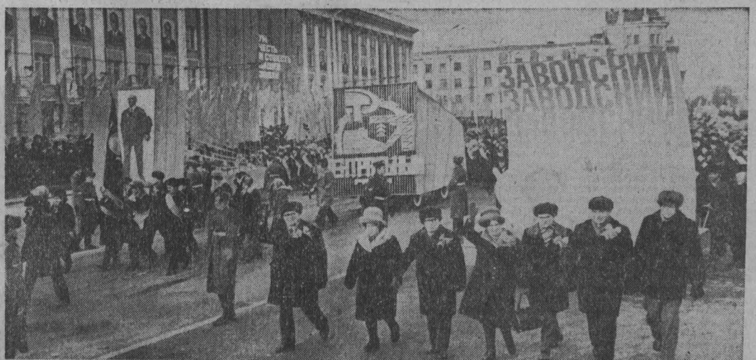
Кемерово. Площадь Советов.

Репортаж с Красной площадью вели корреспонденты ТАСС Т. АККУРАТОВА, Л. БЕРНАСКОНИ, В. ДЖАЛАГОНИЯ, Л. ЕРМАКОВА, В. СЕРОВ.