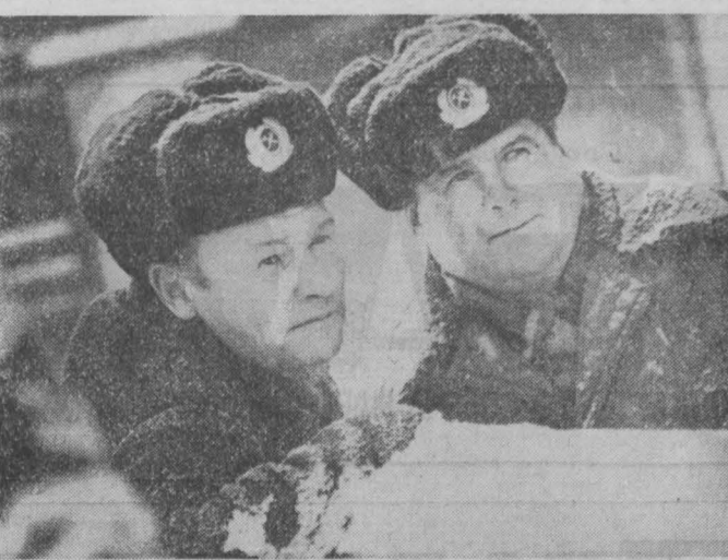
НОВОСТИ СОБЫТИЙ ФАКТЫ В. БЕРЕЗОВСКИЙ

А. АНТОНОВ, корр. «Кузбасса», г. Новокузнецк.