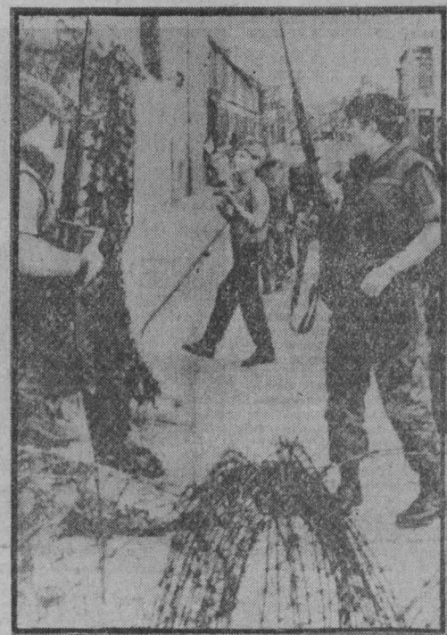
Насилие остается главной чертой повседневной жизни Олстера. Английские солдаты, направленные в провинцию под предлогом «наведения порядка», продолжают чинить произвол в отношении местного населения. Число убитых составляет уже около двух тысяч, раненых более 20 тысяч.

НЬЮ-ЙОРК, 12 октября. (Корр. ТАСС). На проходящей здесь XXXIV сессии Генеральной Ассамблеи ООН социалистические страны выступают с конкретными предложениями, направленными на оздоровление политического климата, обуздание гонки вооружений и укрепление международной безопасности. Мы считаем, заявил на общеполитической дискуссии министр иностранных дел МНР М. Дугарсурин, что кардинальной мерой, способной остановить гонку ядерных вооружений, является достижение договоренности о прекращении производства ядерного оружия во всех его видах и постепенном сокращении его запасов вплоть до полной ликвидации. Конкретное предложение по этому вопросу было выдвинуто социалистическими странами в Комитете по разоружению. Министр призвал Генеральную Ассамблею ООН поддержать важную инициативу и рекомендовать комитету ускорить рассмотрение этого вопроса.