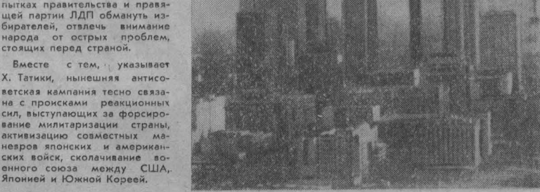
США. Серьезная угроза для здоровья жителей Лос-Анджелеса возникла в результате самого сильного за последние четверть века смога...