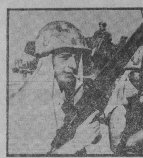
Лицо «свободного» мира

Безработица продолжает оставаться одной из серьезных проблем в Соединенных Штатах. Очередной слад производства, произошедший много в ведущие отрасли американской экономики, тяжким бременем ложится на плечи трудящихся страны. По официальным данным, армия «лишних американцев в ближайшие месяцы увеличится еще на 1-2 млн. человек и составит более семи миллионов американцев. НА СНИМКЕ: очередь на бирже труда. В Соединенных Штатах создается так называемый «апрорус быстрого реагирования», предназначенный для действий на Ближнем Востоке и в районе Персидского залива. Как известно, Pentagon объявляет, что этот экспедиционный корпус численностью 110 тысяч человек создается на