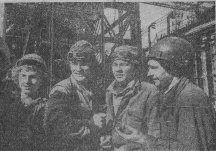
Духом взаимовыручки, были проникнуты последние дни перед пуском...

ромной была их работа, скажу: коксохиммонтажники выполнили объем работ, вдвое превышающий запланированный... Есть кокс пятой!