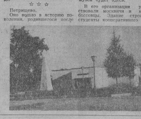
Петрищево. Оно вошло в историю по имени, родившегося после войны.