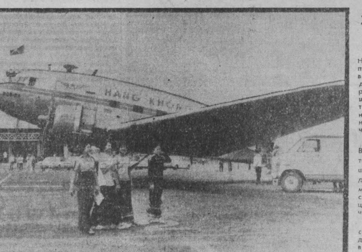
СРВ. С каждым годом увеличивается в стране число авиалиний, которые создают удобства для жителей республик. НА СНИМКЕ: новый аэропорт в провинции Дарлак.

Телевизионная компания Эф-би-си сообщила, что республиканцы намерены возмещать задолженность кандидатуры на пост президента от этой партии бывшего президента Дж. Форда. Его шансы будут довольно высоки.