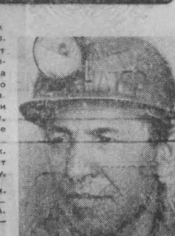
г. Салаир.