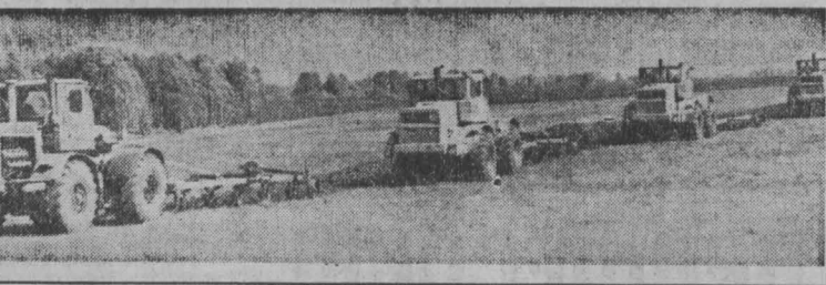
Фотосъемка с воздуха: на пахоту в совхозе «Тыттинский».