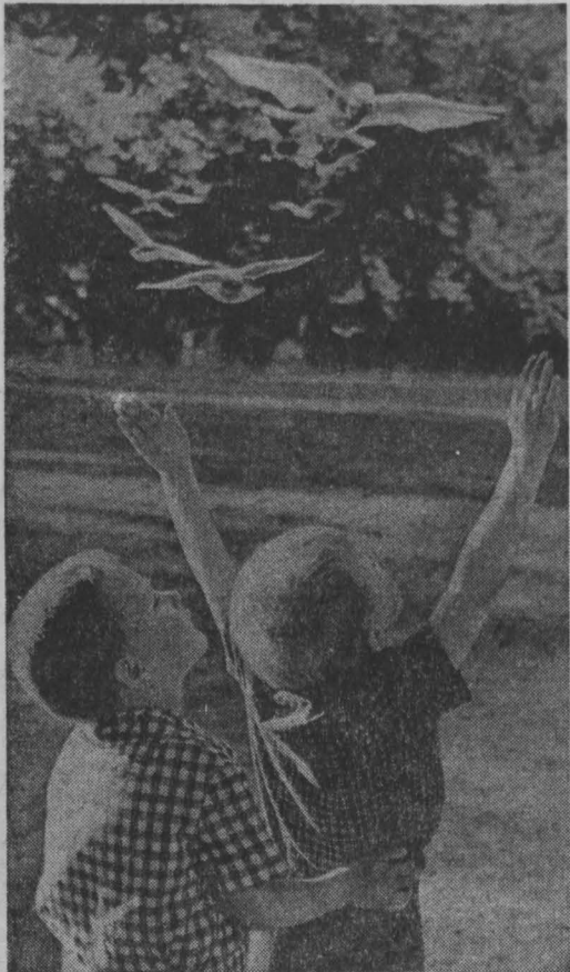
ЛЕТИТЕ, ГОЛУБИ, ЛЕТИТЕ... г. Кемерово.

Горский сельский Совет придает особое значение благоустройству населенных пунктов. На это в прошлом году было затрачено десять тысяч рублей.