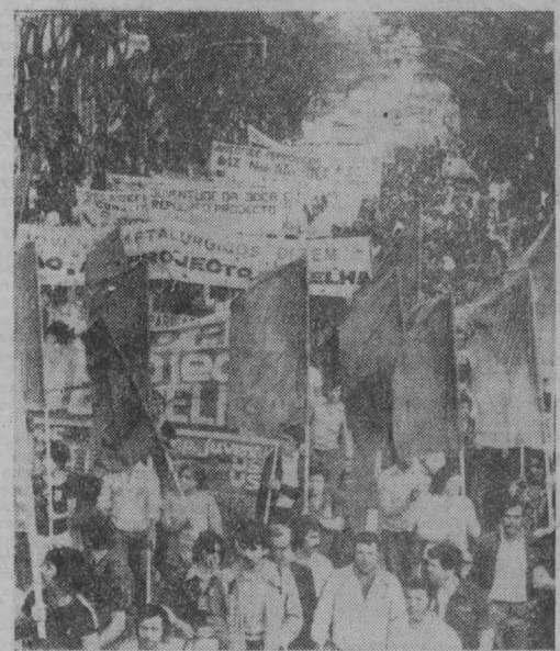
ПОРТУГАЛИЯ. Под знаком укрепления единства профсоюзного движения страны в Лиссабоне состоялся массовый демонстрация трудящихся. По призыву профсоюз в ней принял участие сотни тысяч трудящихся промышленного пояса столицы и Сетубала. Демонстрация протеста против репрессивной политики вынесенного на обсуждение парламента законопроекта «О профсоюзных ассоциациях».