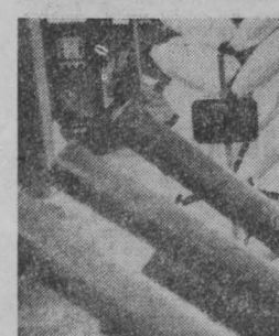
ГДР Комбинат имени Вильгельма Пика в Шарцве (округ Гера) с его пятитысячным коллективом трудящихся — один из крупнейших производителей химического волокна в Германской Демократической Республике. Свою продукцию он поставляет заводу и фабрикам различных отраслей промышленности. Зарубежным партнерам комбината является родственное советское предприятие в Клину. Между предприятиями существует тесные деловые связи.

Лаосский народ, сказал он, сделает все возможное, чтобы и впредь укреплять отношения дружбы и сотрудничества с героическим народом Вьетнама. Мы высоко оцениваем помощь нашему народу со стороны СРВ в восстановлении страны и обеспечении ее обороной.