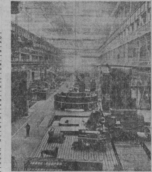
29 АВГУСТА исполняется 35-я годовщина освобождения Румынии от фашистского ига. Румынский народ при всестороннем содействии СССР и других братских стран успешно строит социализм. За минувшие годы создана материально-техническая база социалистической экономики. Объем промышленной продукции вырос более чем в 30 раз. Широное развитие получила образование, наука, культура.

НА СНИМКЕ в турбинном цехе Бухарестского завода типичное машиностроение. Коллектив предприятия трудится под девизом «за высокие качества».