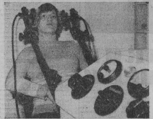
НА СНИМКЕ: в Софийском институте урологии, физиотерапии и реабилитации.

скольким целям: побудить людей к незаконному выезду, дестабилизировать общественный порядок во Вьетнаме, и, используя это, обвинить СРВ в нарушении прав человека, в «экспорте» беженцев. Проводимая Соединенными Штатами демонстрация силы обостряет напряженность в Юго-Восточной Азии. Их действия игнорируют лишь на руку Пекину в его упорной антиазиатской кампании, подчеркивает газета.