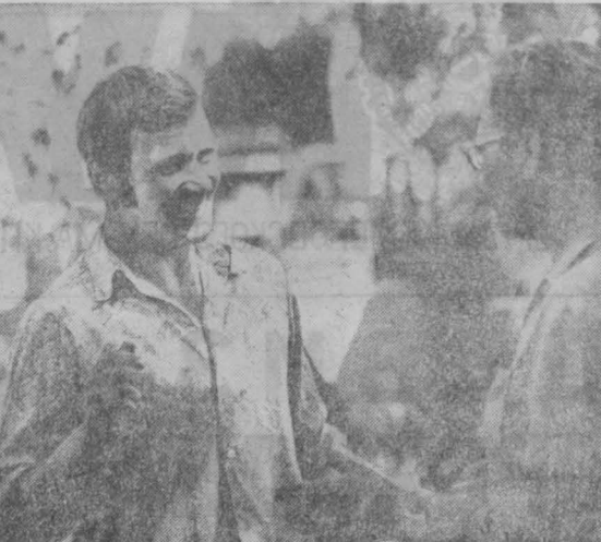
Зеленая жатва — ударный фронт