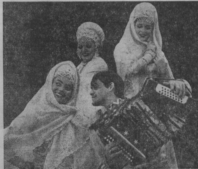
В НОВОКУЗНЕЦКЕ и Киселевске с большим успехом прошли концерты Оренбургского государственного русского народного хора.