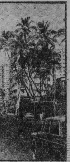
Бомбей — крупный промышленный и культурный центр Индии, побратим Ленинграда.