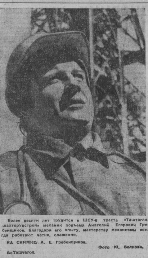
ИА СНИМКИ: А. Е. Гребенищев, г. Таштагол.

Возвращение. В конце минувшего года в «Кузбассе» было опубликовано письмо с названием «Картошка. Какой пейзаж? Речь в нем шла о взаимоотношениях города и села.