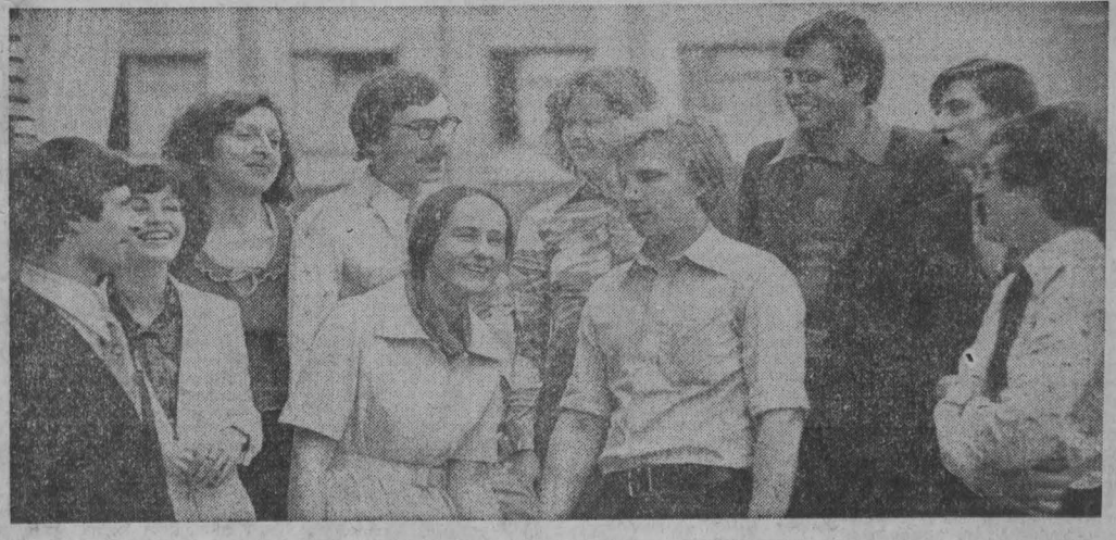
НА СНИМКЕ: студенты третьего курса Кемеровского государственного медицинского института.