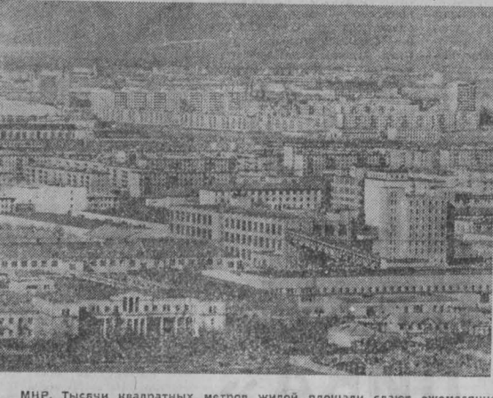
МНР. Тысячи квадратных метров жилой площади сдают ежемесячно строители монгольской столицы.

Вниманию государственных деятелей, общественности, средств массовой информации всего мира по-прежнему приковано к советско-американским переговорам на высшем уровне в Вене.