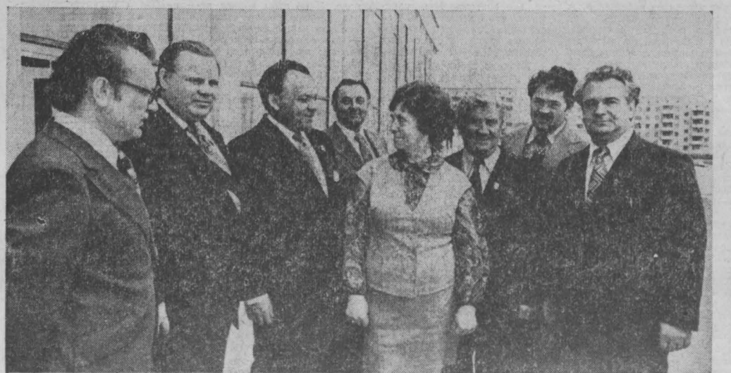
Фото П. Костюкова, г. Кемерово.

соревнование, организаторская работа партийных групп и постов народного контроля, которые действуют в каждом механизированном комплексе. Коммунисты показывали пример высокопроизводительной и отог труда, обеспечили подведение итогов за день и неде-