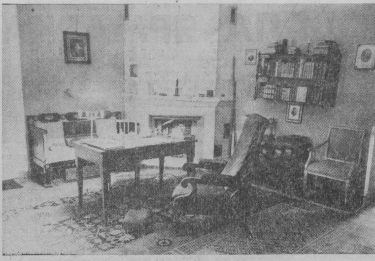
СЕГОДНЯ — 180 ЛЕТ СО ДНЯ РОЖДЕНИЯ А. С. ПУШКИНА