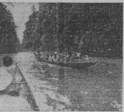
Филиппины — государство в Юго-Восточной Азии, расположенное на 7100 островах, из которых обитаемых всего 800. Тридцать один год назад Филиппины провозгласили независимость, однако до сих пор республика остается под неустанным контролем западных монополий, являясь источником дешевого сырья и рабочей силы.

Обращает на себя внимание и попытка в демagogических целях свалить вину за мировой экономический кризис на организацию стран — экспортеров нефти и тем самым скрыть подлинную роль в этом вопросе империалистических монополий.