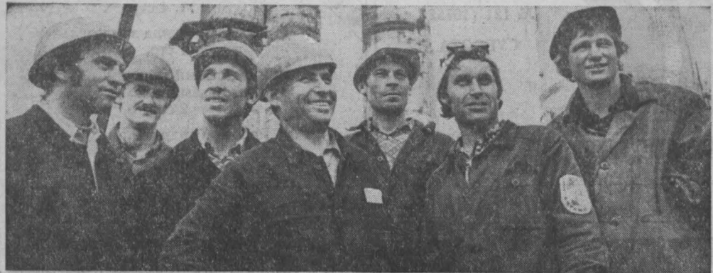
На строительстве объектов минеральных удобрений