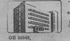
г. Кемерово.

Адрес редакции и издательства: 650830, ГСП, г. Кемерово-99, ул. Ногрская, 3. Телефоны: приемной редактора 6-69-74, заместителей редактора 6-65-74, 6-70-82, ответственного секретаря 6-65-63, отделов редакции: партийной жизни 6-61-53 и 6-02-08, пропаганды 6-66-73, 6-44-22, Советов народных депутатов 6-63-44, тяжелой индустрии 6-63-44, 6-51-02, 6-62-37, легкой индустрии 6-65-36, 6-38-49, сельского хозяйства 6-67-82 и 6-90-71, культуры 6-62-11, 6-47-44, строительного 6-67-46 и 6-02-04, писем и расслелаторов 6-90-52, 6-78-97, 6-87-68, 6-80-72, информации в спорте 6-82-61, 95-58-76, 6-62-37, еженедельника «Панорама» 6-63-02, объявлений 6-68-72, фотокорреспондентов 6-90-63, приема информации 6-88-85, общественной приемной 6-66-52, бухгалтеру 6-89-53, директора издательства 6-69-23. Собственные корреспонденты: в Новокузнецке — 7-02-04, Прокопьевске — 2-17-34, Ленинске-Кузнецком — 2-03-21, Белове — 2-01-43, Междуреченске — 33-04, Юрге — 2-06-09.