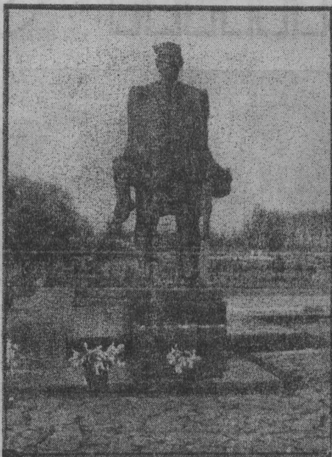
пленников, подожгли. А тех, кто пытался вырваться из огня, расстреливали в учер. 149 человек, в том числе 75 детей, леги в братской могиле. Из всех хатыньских детей, что оказались в сарае, только двое мальчиков остались живыми. Вырвавшись из огня, они нашли спасение в лесу. Да еще трое ушли от фашистских пуль в то время, когда каратели окружили деревню. Остальные погибли в огне. Погибли, но не покорились. И как символ непокоренного советского человека, в центре Хатыньского мемориала поднялась бронзовая фигура мужчины в расстегнутой обгоревшей рубашке с мертвым ребенком на руках. Он смотрит вадаль, и его разמתаные ветром волосы похожи на серый нлок дыма. Стоит он как гнев и боль советского народа, как вечная память по расстрелянным и сожженным.

Все 26 дворов Хатыни уничтожены огнем. Сейчас на месте каждого подворья чернеют закопанные в землю кирпичи вен, чьи срубав, а над ними, как печные трубы, на пепелищах, возвышаются обелиски, увенчанные колоколами.