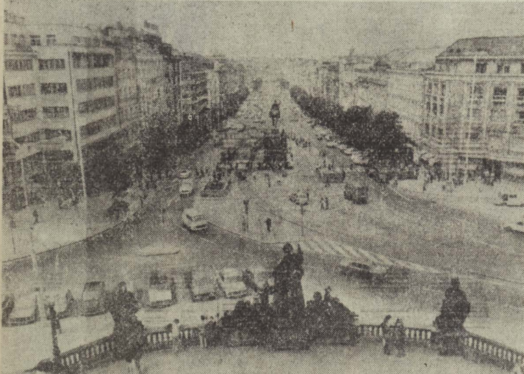
9 мая — освобождение Чехословакии от фашистских захватчиков, национальный праздник народов ЧССР. НА СНИМКЕ: Прага. Валцская площадь — одна из центральных в чехословацкой столице.