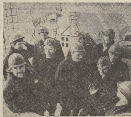
Работать без отстающих

Занести лауреатов премии Кузбасса за 1978 год в областную книгу Почета «Летопись борьбы трудящихся Кузбасса за коммунизм».