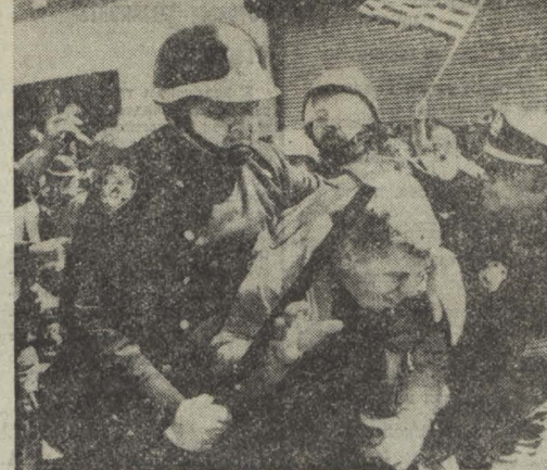
США. Серьезные столкновения бастующих доставляют мольбу с полиции произошли в Нью-Йорке. С целью сорвать забастовку, которая длится уже около двух месяцев, властями Нью-Йорка направили против бастующих дувинки, штурмовые отряды. В результате столкновения более 20 человек ранены. НА СНИМКЕ: полицейские расправляются с бастующими. (ТАСС).

отношения между двумя странами — один из важных факторов процесса разрядки между Востоком и Западом, вклад в дело взаимопонимания между народами и народами в Европе. Ход и атмосфера нынешней советско-французской встречи на высшем уровне убедительно свидетельствуют, что СССР и Франция, которые лет назад начали закладывать фундамент разрядки в Европе, несомненно, выйдут из переговоров с новыми мощными импульсами движения по пути и упрочению мира и взаимопонимания между народами, подчеркивает болгарская «Работническо дело». Л. И. Брежнев подчеркнул, что в сотрудничестве СССР и Франции открываются новые просторные горизонты. А это значит,