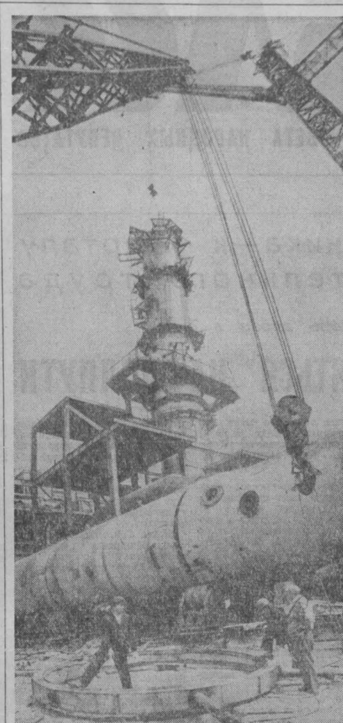
Так совсем недавно выглядела строительная площадка аммака-2 производственного объединения «Азот».