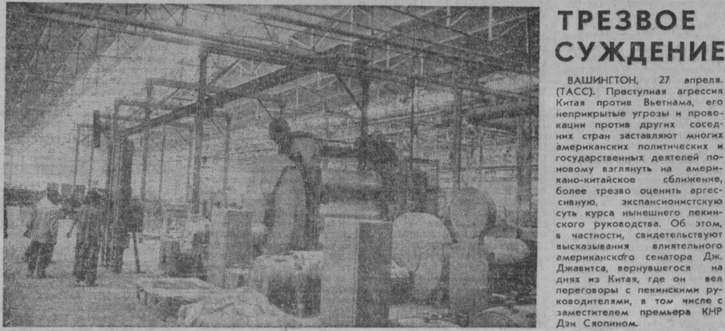
КАЖДАЯ ДЕНЬ приносит новые изменения в жизни Капуччи. Ее народ, став хозяйном страны, приступил к мирному созидательному труду. МА СИНМКЕ в пятиэтажном здании, расположенном на южной окраине Пномпеня. Фотохроника ТАСС.