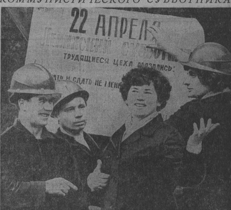
Цех № 1 — один из крупнейших в кемеровском производственном объединении «Хитпром». Три сестры этого коллектива досрочно пролегли свой коммунистический субботник. Вчера здесь трудилась четвертая смена. Этот коллектив работает на сырой руде.

Подготовили семена. А сегодня 180 человек вышли на переборку картофеля.