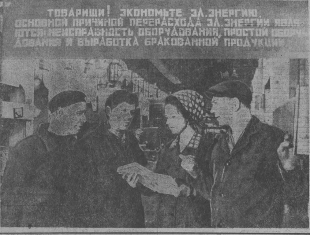
ТОВАРИЩИ! ЭКОНОМЬТЕ ЭЛ ЭНЕРГИЮ. ОСНОВНОЙ ПРИЧИННОЙ ПЕРЕРАСХОДА ЭЛ ЭНЕРГИИ ЯВЛЯЮТСЯ НЕИСПРАВНОСТЬ ОБОРУДОВАНИЯ, ПРОСТОЙ ОБОРУДОВАНИЯ И ВЫРАБОТКА БРАКОВАННОЙ ПРОДУКЦИИ