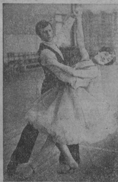
В спортивном зале института культуры с утра не смолкает музыка. В областном конкурсе балетных танцев участвуют двадцать танцевальных пар и семь ансамблей из Кемерово, Новокузнецка, Бельозерского, Белова.

Перед жюри и зрителями танцевальные пары исполняют советские танцы. Подвижной «Вару-Вару» и размеренный, спокойный фигурный вальс, ритмичную румбу, кокетливый вальс-мазурку, задорный краковяк, стилизованные «Сударушку» и «Любовь» продемонстрировали начинающие пары и те, кто уже не первый раз выступает на областном конкурсе.