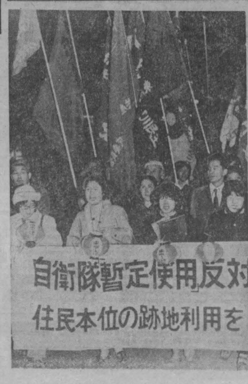
自衛隊暫定使用反対 住民本位の跡地利用を

Одновременно с обстрелом военные формирования консервативных сил Ливана при поддержке танков предприняли широкое наступление на позиции национально-патристических сил и Палестинского движения сопротивления в районе населенных пунктов Марджун, Ибл, Ас-Сайя и Хиям.