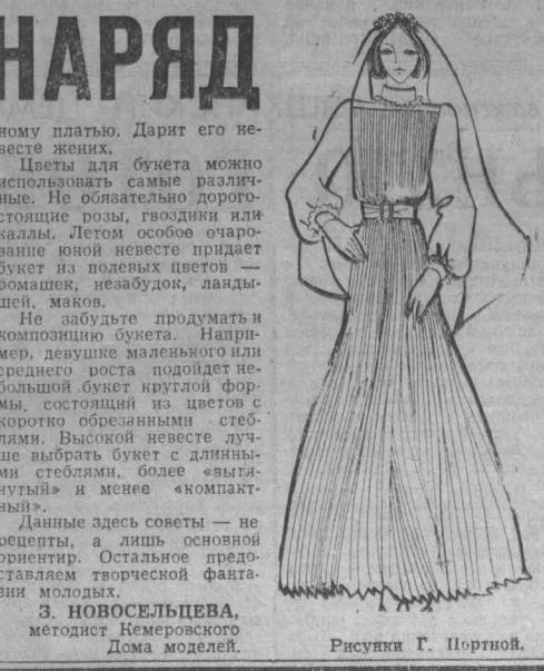
Рисунки Г. Портной.

З. НОВОСЕЛЦЕВА, методист Кемеровского Дома моды.