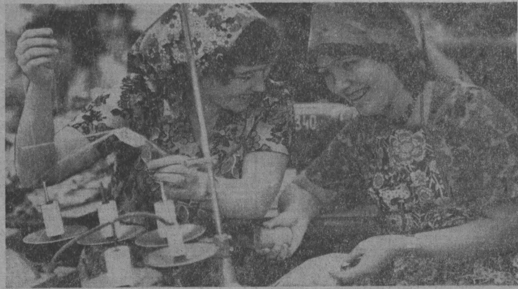
ПРОДУКЦИЯ швейной фабрики «Березка» хорошо известна в Кузбассе...