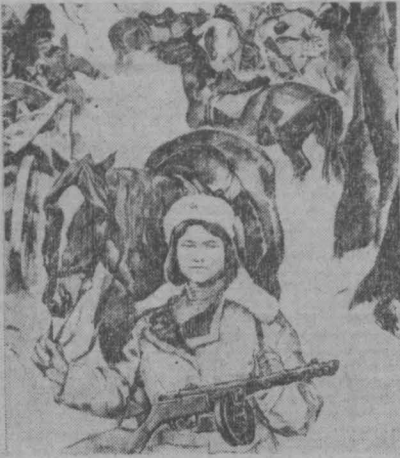
«60 героических лет»