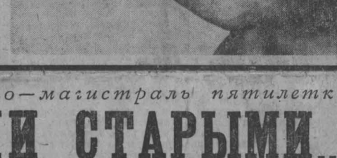
Б. КОЗЛОВ, корр «Кузбасса».

Уехали на обжитые места назначенный директор, почти все главные специалисты. Остались самые испытанные, самые умелые, самые опытные, но более дерзновенные.